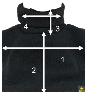
Tableau des tailles

Utiliser dans les environnements de travail froids sur ou sous les casques de sécurité.