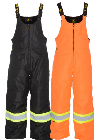
VPK655- VPK656 Pantalon hiver X-treme -40°C