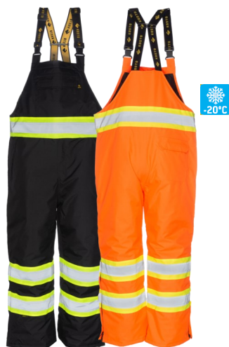
VPK775/VPK975 Pantalon hiver