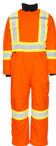
VCK115 Couvre-tout -20°C