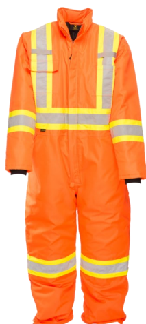
VCKH40 Couvre-tout -40°C